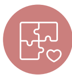
LA COHÉSION SOCIALE ET LA SOLIDARITÉ ENTRE LES TERRITOIRES