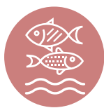
LA PRÉSERVATION DE LA BIODIVERSITÉ, DES MILIEUX ET DES RESSOURCES