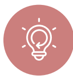
UNE DYNAMIQUE DE DÉVELOPPEMENT SUIVANT DES MODES DE PRODUCTION ET DE CONSOMMATION RESPONSABLES

Chaque année, Carcassonne Agglo présente à travers le rapport de développement durable son engagement envers la durabilité.