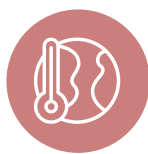
LUTTE CONTRE LE CHANGEMENT CLIMATIQUE