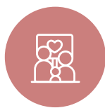
L'ÉPANOUISSEMENT DE TOUTS LES ÊTRES HUMAINS